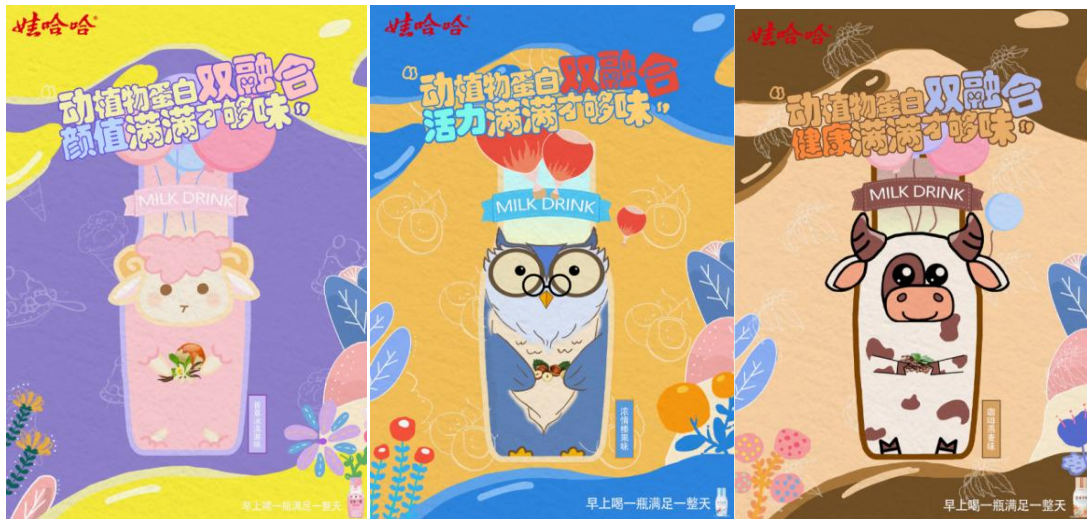
哇哈哈企业宣传海报设计作品