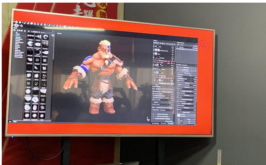
学生数字游戏实训课作品展示