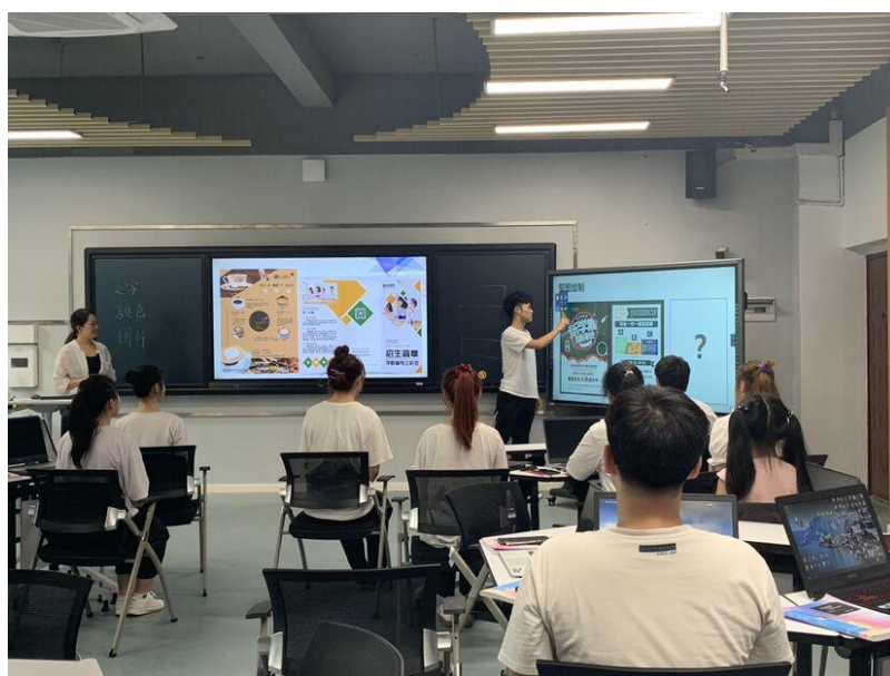
学生 UI 设计实训课作品汇报