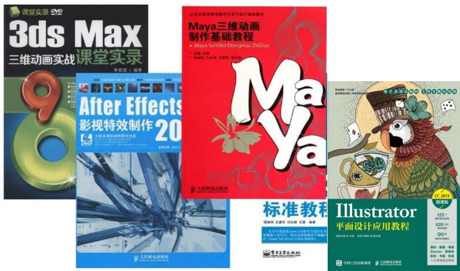
部分专业主干课程

数字绘画、插画设计、网页设计与制作、平面设计、游戏原画设计、premiere 影视剪辑、AE 影视后期制作、Python 前端开发语言、三维数字建模、三维动画设计与制作（UE4）、三维材质与渲染、C4D 动画设计、新媒体运营等课程。