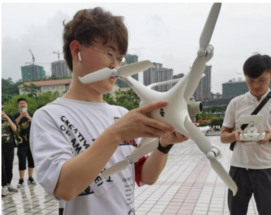
学生运用专业技术进行拍摄练习