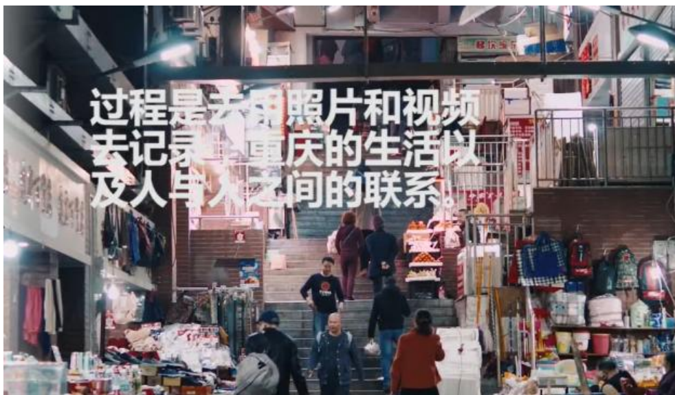
重庆旅游宣传视频设计作品