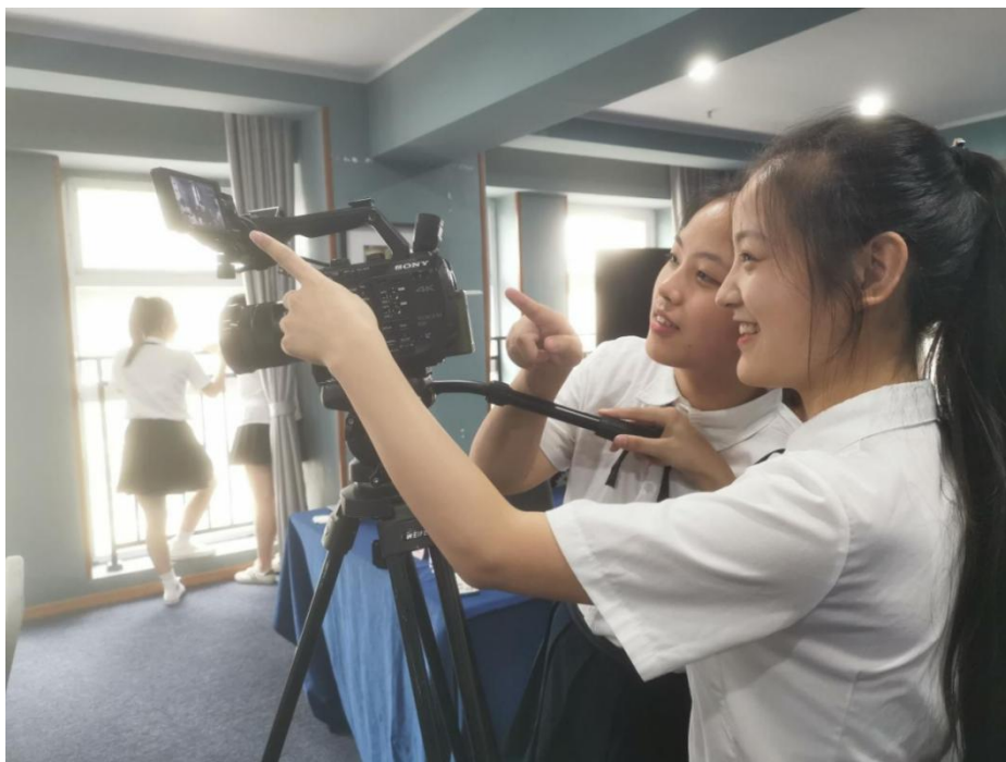
学生拍摄制作微视频