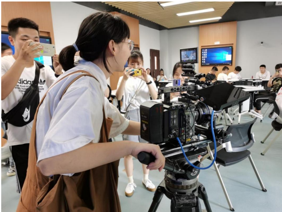
学生进行影视特效与合成实训

本专业的实践实训项目主要有网页设计与制作、UI设计、插画设计、微视频创作、影视特效与合成、三维建模与游戏动作设计等。