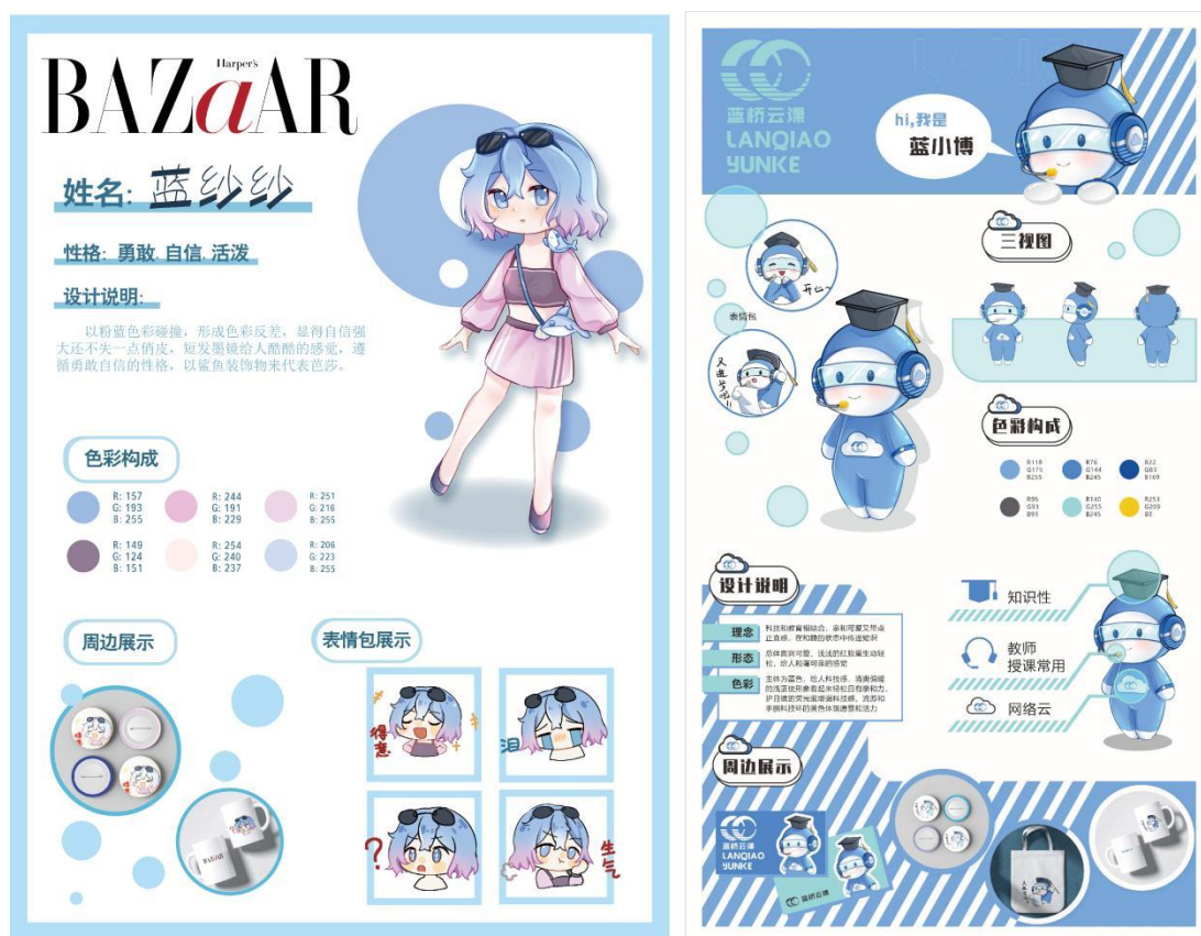
芭莎杂志/蓝桥云课网站 IP 形象设计作品